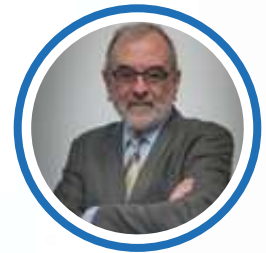
JEAN-NOËL FERRIÉ, POLITOLOGUE UNIVERSITÉ INTERNATIONALE DE RABAT